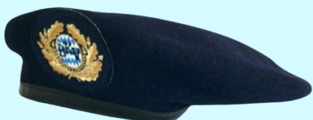
Barett Gold für Vorsitzende 28,80 €