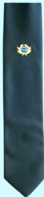
Krawatten 20,40 € Silber für Mitglieder Gold für Vorsitzende