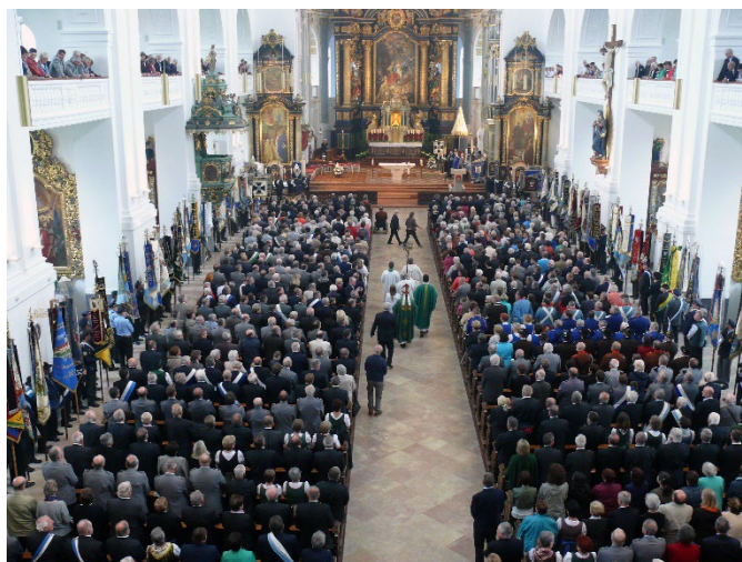
60 Jahre BKV 2016 in der Basilika Altötting – ein eindrucksvolles Bild mit den vielen Fahnen.

Die Fahrkosten werden wieder zur Hälfte übernommen. Aktuelles dazu werden wir auch auf unsere Homepage veröffentlichen.