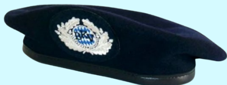
Barett Silber für Mitglieder 28,80 €