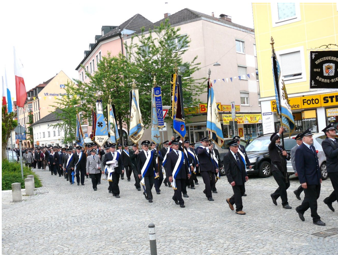
Der feierliche lange Festzug zur Basilika