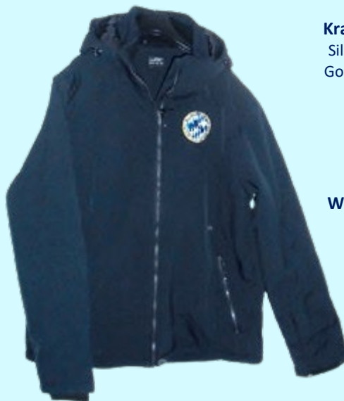
Winter-Sportjacke 95,70 €

BKV Bekleidungswesen – Verkaufsprospekt mit allen Artikeln anfordern! Siehe Kontaktdaten auf der letzten Innenseite