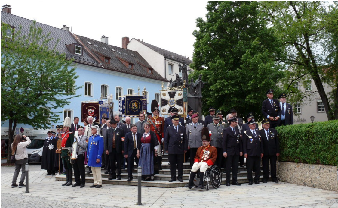
Die Ehrengäste mit dem Präsidium – aufgestellt zum Defilee

Den 14. Juni 2026 dazu einplanen. Wer 2016 dabei war weiß, was er sonst verpassen würde.