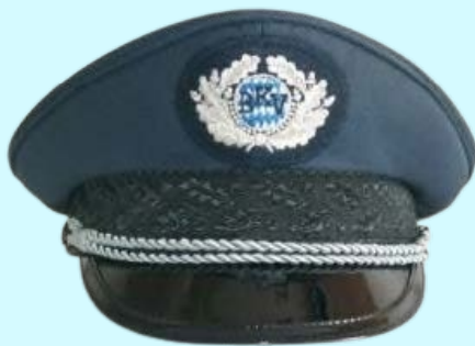
Fahnenabordnung Ortsverein 72,60 €