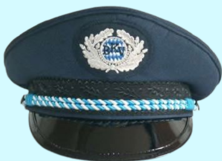
Mitgliedermütze 72,60 €