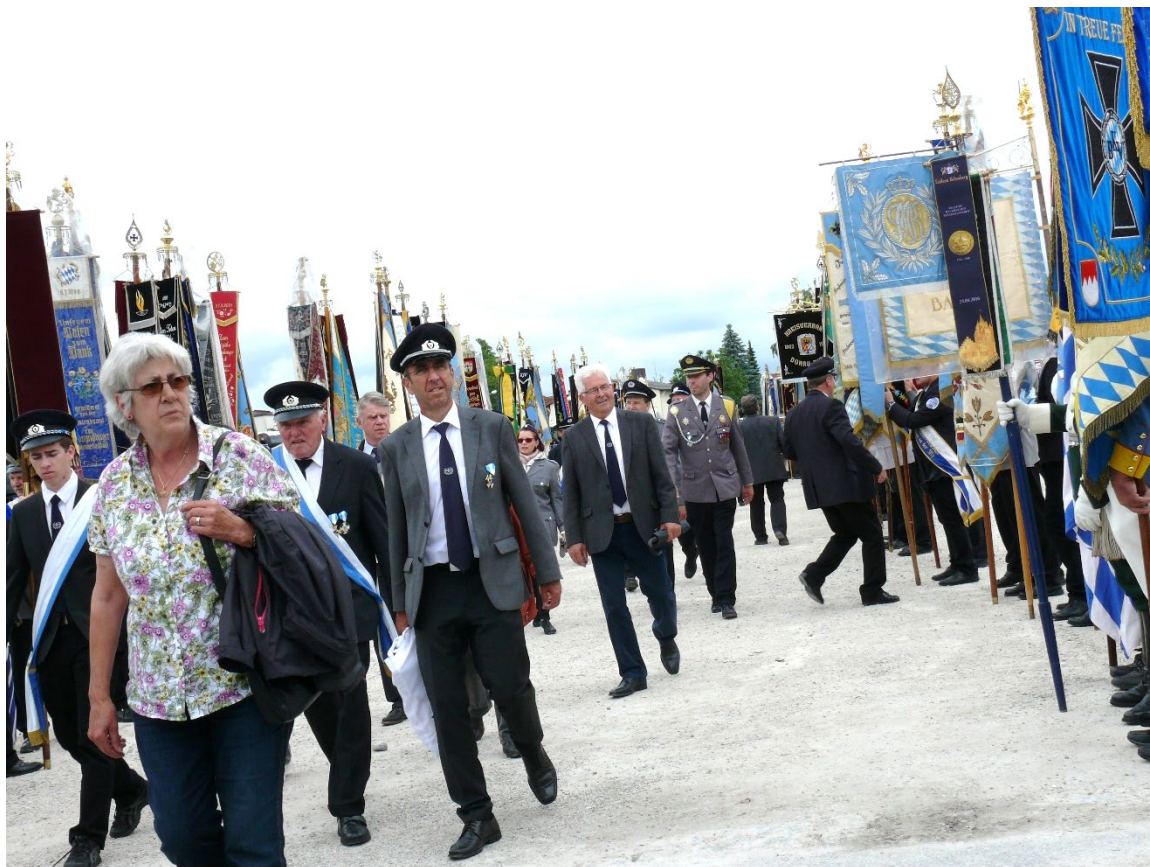
Zugaufstellung auf dem Dultplatz in Altötting