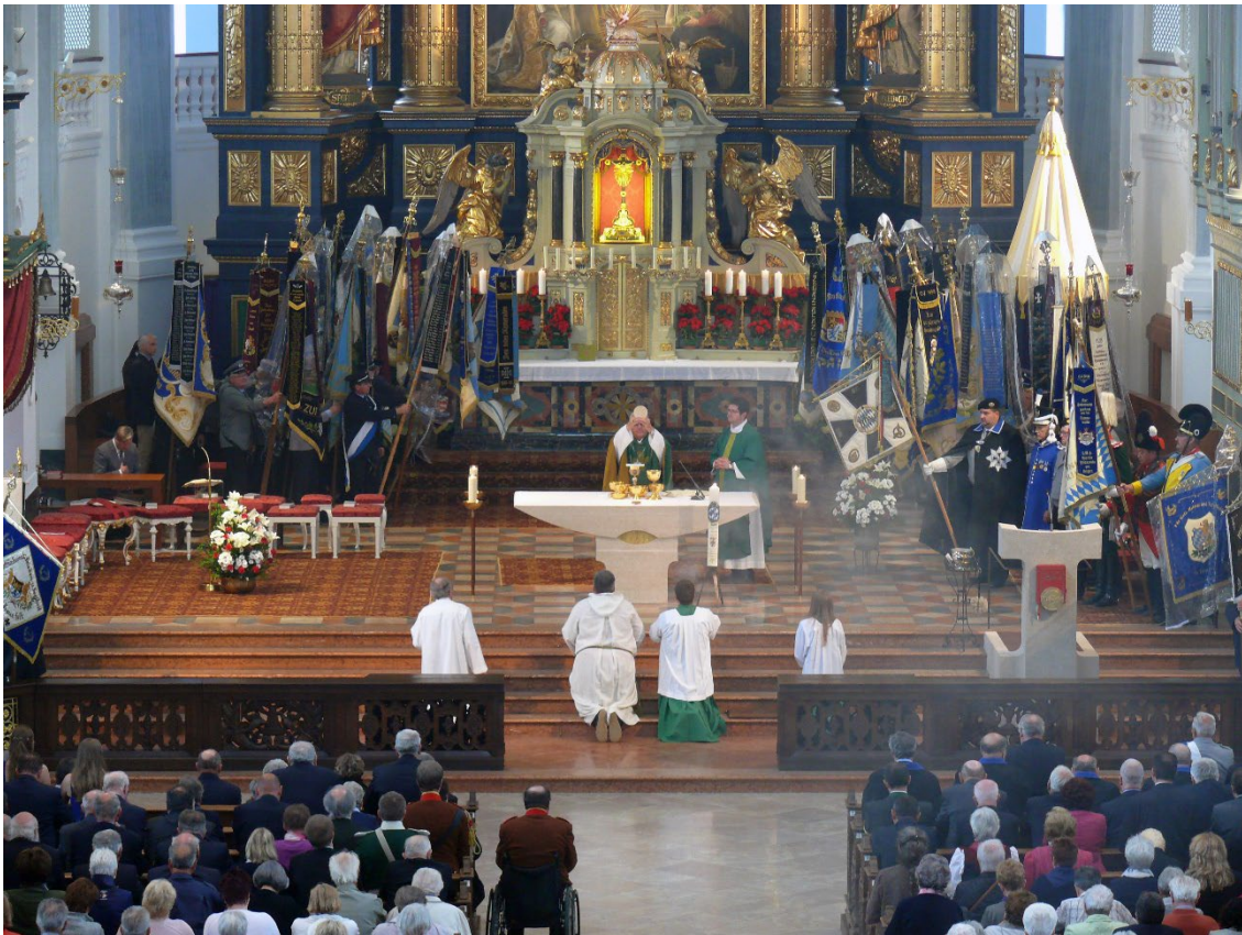
Messe in der Basilika