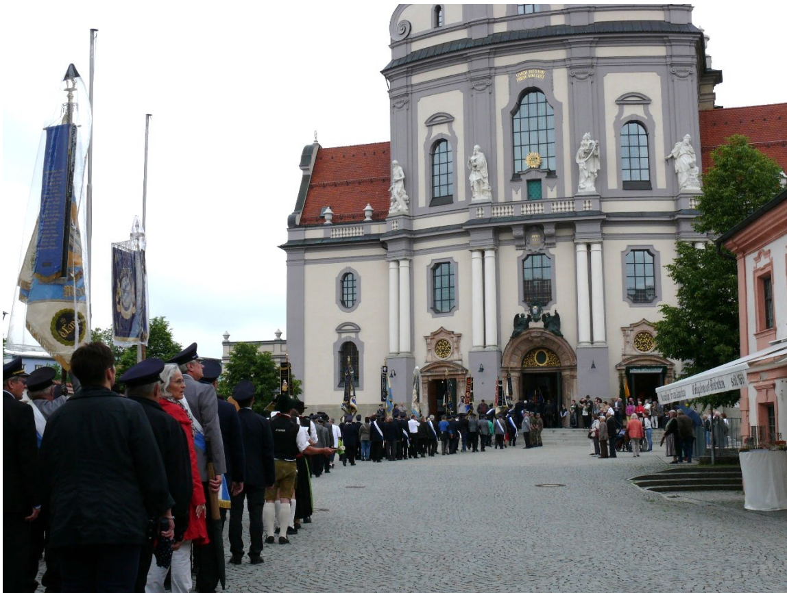
Ankunft an der Basilika

Ein unvergesslicher Anblick die Basilika mit den tausenden Kameradinnen und Kameraden und den vielen Fahnen